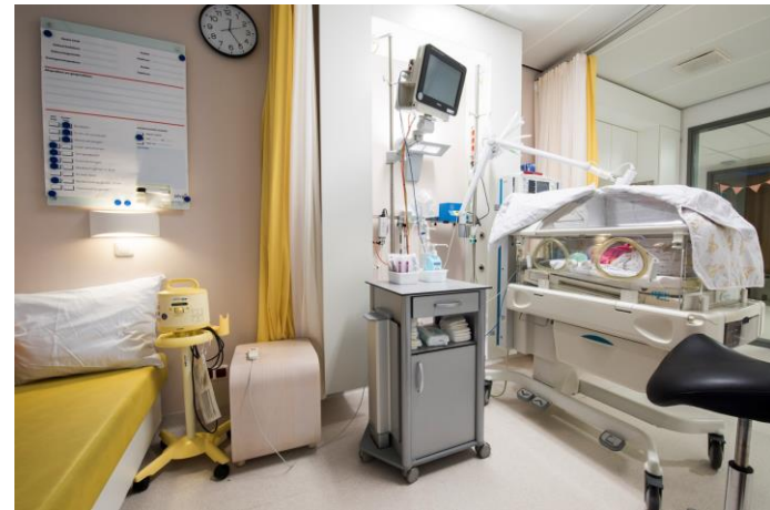
Neo-suite met bedbank